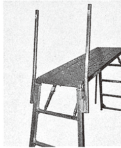
MB150には回転収納構造のグリップが標準装備となります。